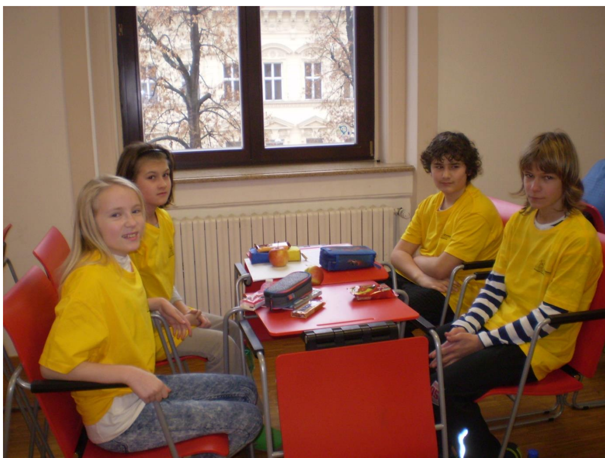
Před zahájením soutěže