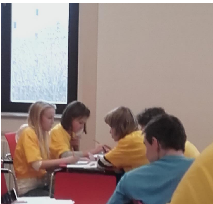
V průběhu soutěže