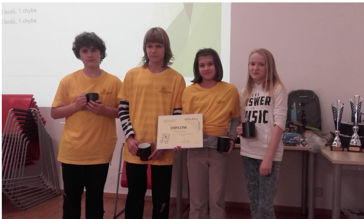
Po vyhlášení výsledků