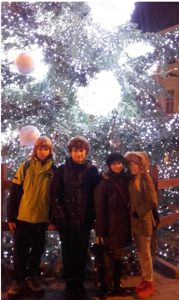
Večerní procházka Brnem